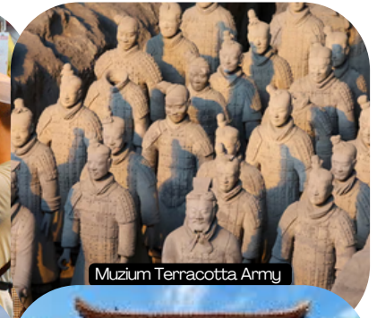
Muzium Terracotta Army