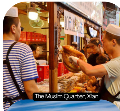
The Muslim Quarter, Xi'an